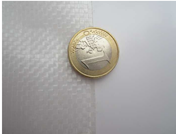
Bild 1: Gewebefolie (0,2 mm dick, PE-HD, laminiert mit PE-LD-Folie) und Gewächshausfolie (0,2 mm dick, PE-LD) (weißes Schreibpapier hinterlegt)

dass die Gewebefolie sich unter Last mehr oder minder starr verhält, wohingegen die Gewächshausfolie elastischer auf z.B. Windeinwirkungen reagiert und dadurch die Kräfte auf eine größere Fläche und die Linieneinspannung verteilt. Bild 1 zeigt eine Aufsicht auf eine Gewebe- und eine Gewächshausfolie.